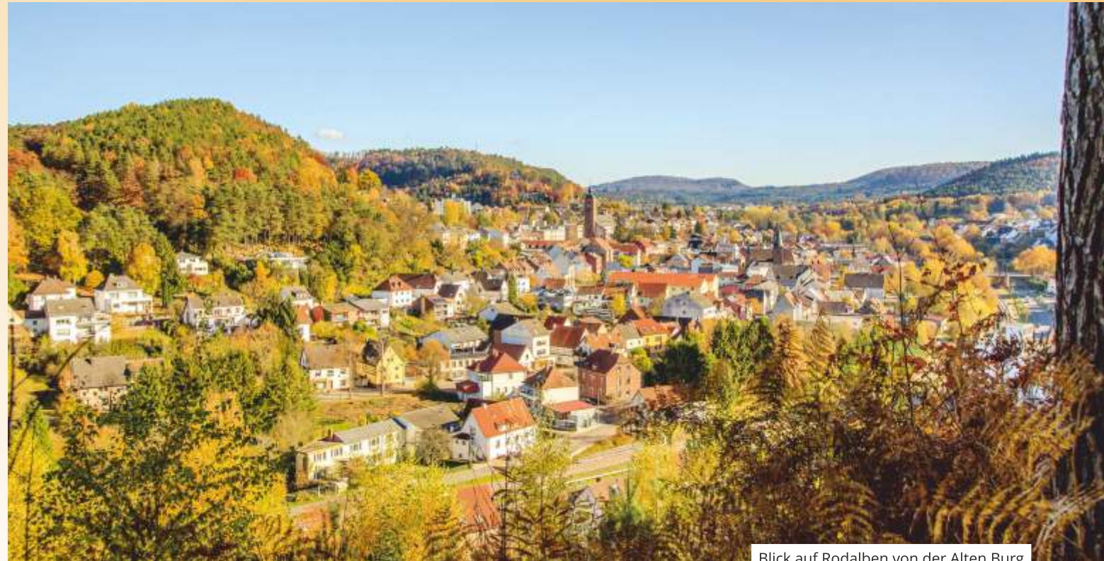
Blick auf Rodalben von der Alten Burg