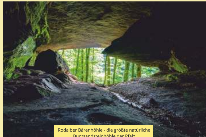
Rodalber Bärenhöhle - die größte natürliche Buntsandsteinhöhle der Pfalz

Vier Infotafeln im Stadtgebiet erleichtern Ihnen die Orientierung und sind Einstiege zum Felsenwanderweg.