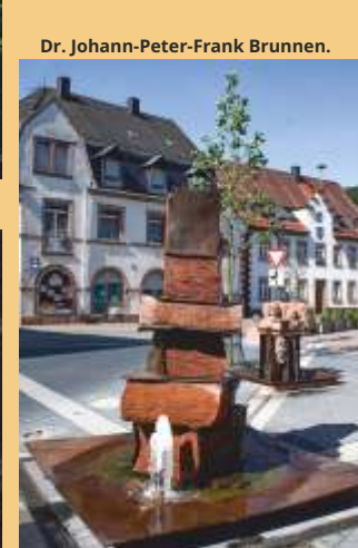
Dr. Johann-Peter-Frank Brunnen.