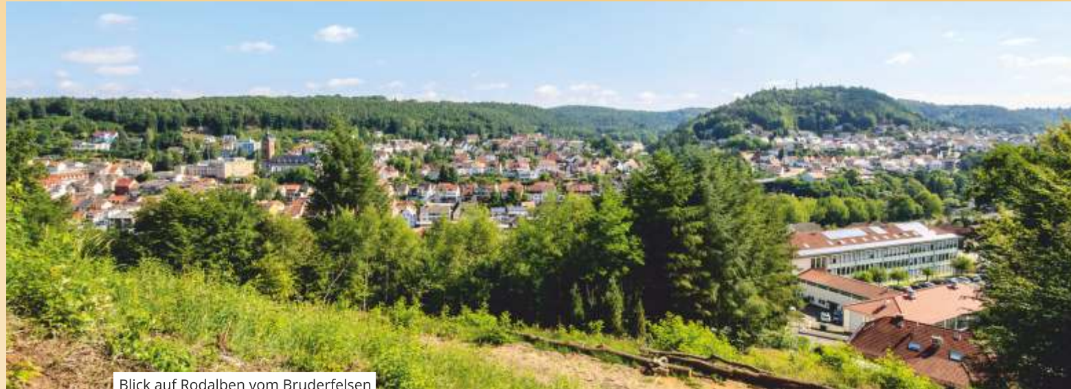
Blick auf Rodalben vom Bruderfelsen

1. zertifizierter „Qualitätsweg Wanderbares Deutschland“ in der Pfalz