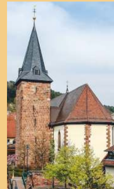
Die Marienkirche im Ortskern von Rodalben wurde im 14. Jahrhundert erbaut. Aus dieser Zeit stammen auch die Wand- und Deckenmalerei im Seitenchor Hoch- und Seitenaltar aus der Zeit um 1750.