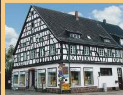
Das Geburtshaus von Dr. Johann Peter Frank Leibarzt von Zar Alexander I. und Begründer der Sozialhygiene