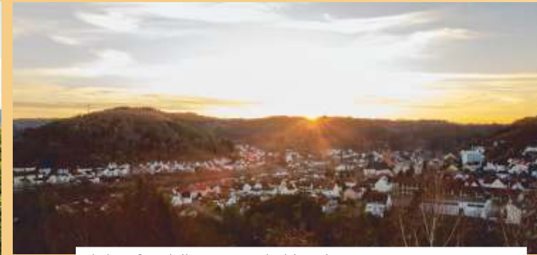
Blick auf Rodalben vom Hilschberghaus mit Sonnenuntergang