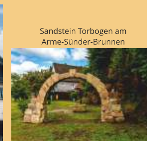
Sandstein Torbogen am Arme-Sünder-Brunnen